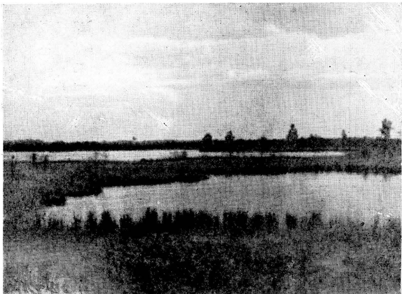
1. att. Ezeriņi Taures purvā.