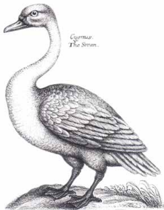
Viens no pirmajiem paugurknābja gulbja zīmējumiem, publicēts 17. gadsimtā (Willungby, Ray 1676). Paugurknābja gulbi kā sugu zinātniski aprakstīja tikai pēc gadsimta – 1789. gadā.

kad laivas tiem pienāca pārāk tuvu, tie cēlās ar spārnu sitieniem, un viņu smagais lidojums šalca gaisā; tikai mātes, noraižējušās par neaizsargāto perējumu, peldēja atpakaļ niedrēs. ” Šeit ir svarīgi norādīt uz pieminēto aizliegumu medīt gulbjus ligzdošanas periodā līdz oktobrim – laikam, kad jaunie paugurknābja gulbji iegūst lidotspēju 3 un/vai atlido rudens migranti no citām vietām. Neskatoties uz to, ka Šlipenbahs nenorāda konkrētu ezera apmeklējuma datumu (pēc viņa biogrāfijas datiem, tas varēja būt periodā no 1796. līdz 1809. gadam), varētu pieņemt, ka vēl 19. gadsimta sākumā gulbji Papes ezerā ligzdoja. Vairāk konkrētas informācijas par gulbju ligzdošanu šajā ezerā atrast neizdevās, kaut gan vēl pēc vairākām desmitgadēm – 1843. gadā – Liepājas avīzē ievietots aicinājums pieteikties uz nomas tiesību izsoli ar iespēju medīt gulbjus un citus ūdensputņus Papes ezerā periodā no 1844. gada 1. janvāra līdz 1848. gadam (Anonymous 1843), bet tas varēja attiekties tikai uz migrantiem.