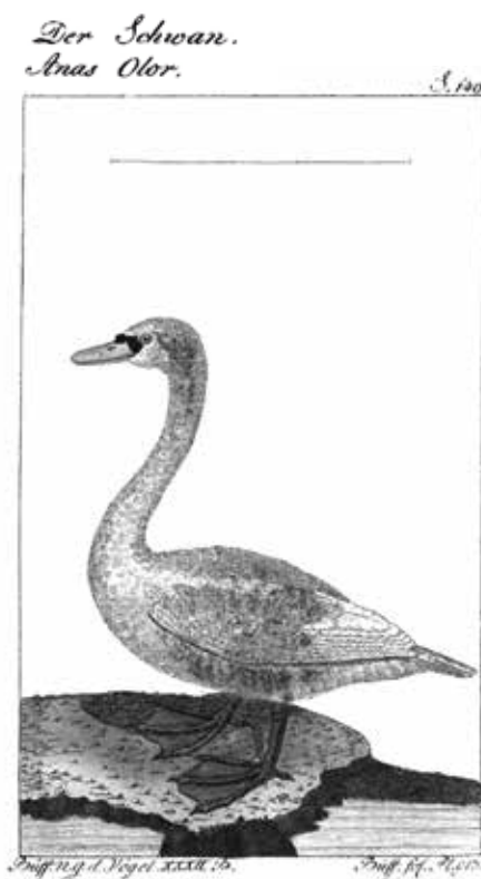
Paugurknābja gulbja zīmējums, publicēts 1806. gadā (Buffon 1806).