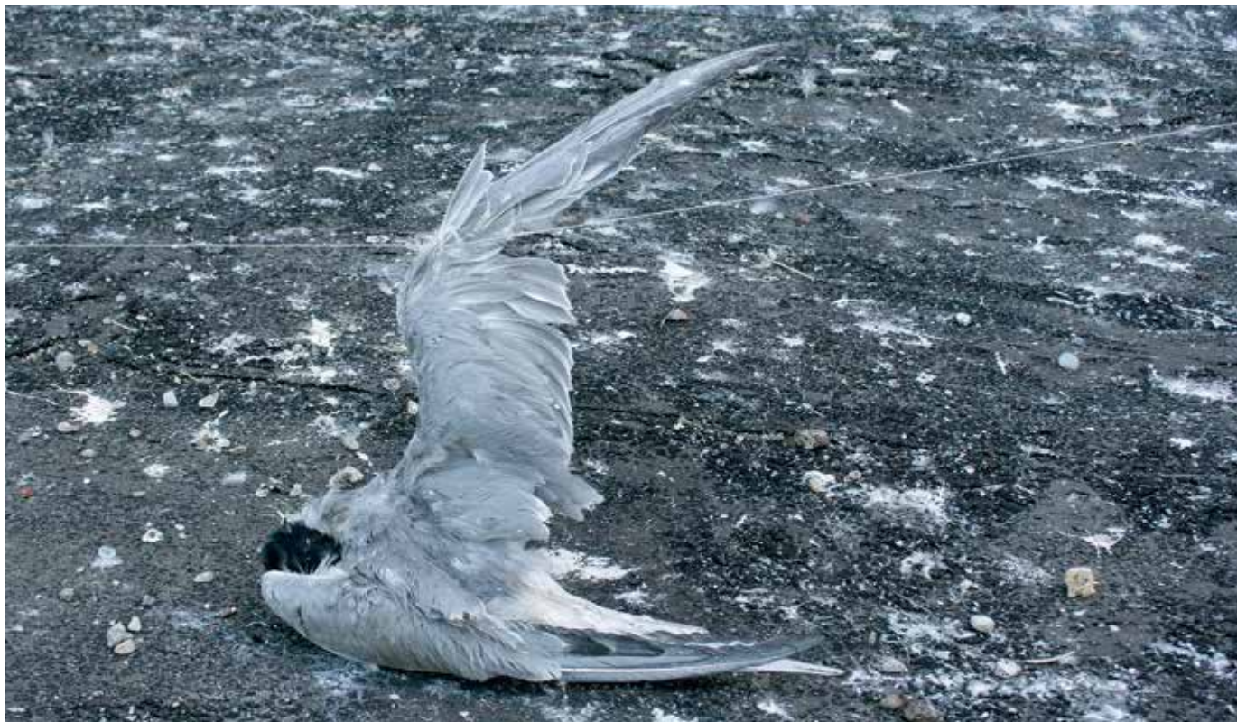
Upes zīriņš gājis bojā mokošā nāvē, pakaroties makšķerauklā, kas uz Rīgas Tehniskās universitātes jumta bija nostiprināta, lai aizbiedētu tur ligzdojošus putnus; 2008. gada 29. maijs.

das maliņu no atkritumiem – izsmēķiem, stiklu lauskām, skrūvēm, vadiem un citiem priekšmetiem, kuri mētājās uz jumta. Piepalīdzēja arī blakus ligzdojošie lielle ķīri, kuri savu ligzdu būvēšanai salasīja apkārtnē niedres, zariņus un sauso zāli, ko vējš izpūta pa visu jumtu.