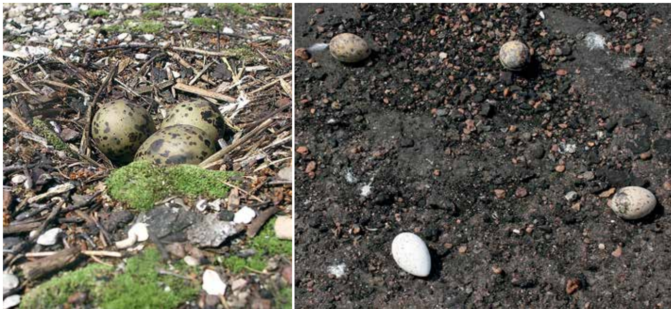
Upes zīriņa ligzda sūnās uz vecā jumta pārklājuma (pa kreisi) un no ligzdām aizripojušas olas uz jaunā pārklājuma.