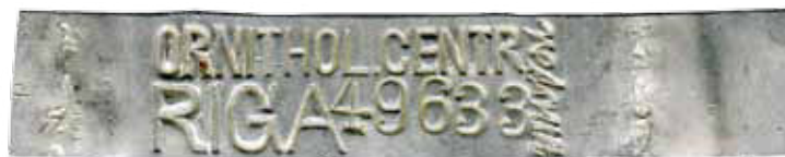
Latvijas Ornitoloģiskās centrāles putnu gredzens. 20. gadsimta 30. gadi.