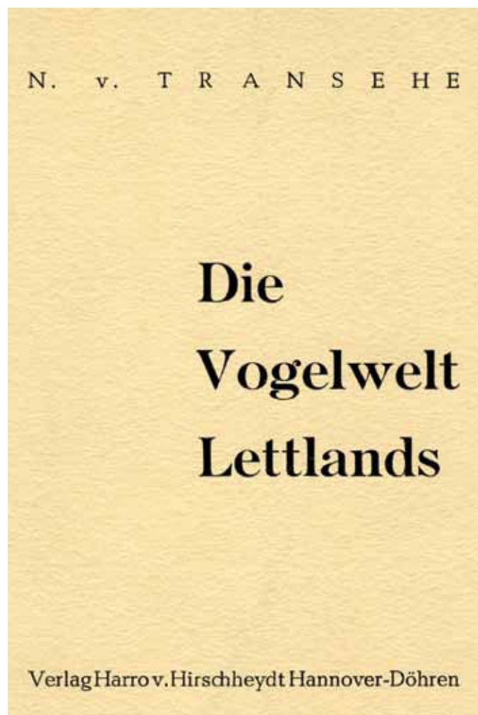
1965. gadā Vācijā izdotā grāmata «Latvijas putnu pasaule».