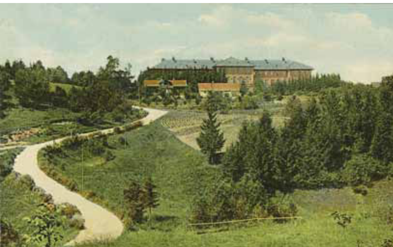
Cēsu Bēraines skola, kurā mācījās Haralds fon Loudons. 1914. gads.