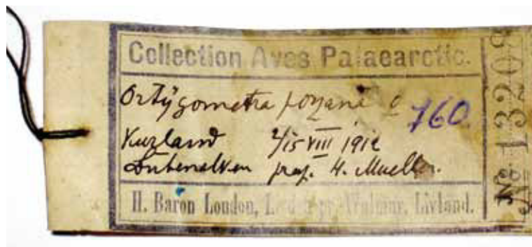
Katrai putna ādiņai kolekcijā pielikta informācija ar putna nosaukumu, iegūšanas datumu, vietu, ieguvēja vārdu, preparatora vārdu un numurāciju katalogā.

20. gadsimta 20. gados latviešu presē maz rakstīja par baltvācu baroniem, bet viens no aktīvākajiem putnu vērotājiem, preparatoriem un publicistiem – Strenču virsmežniecības virs-